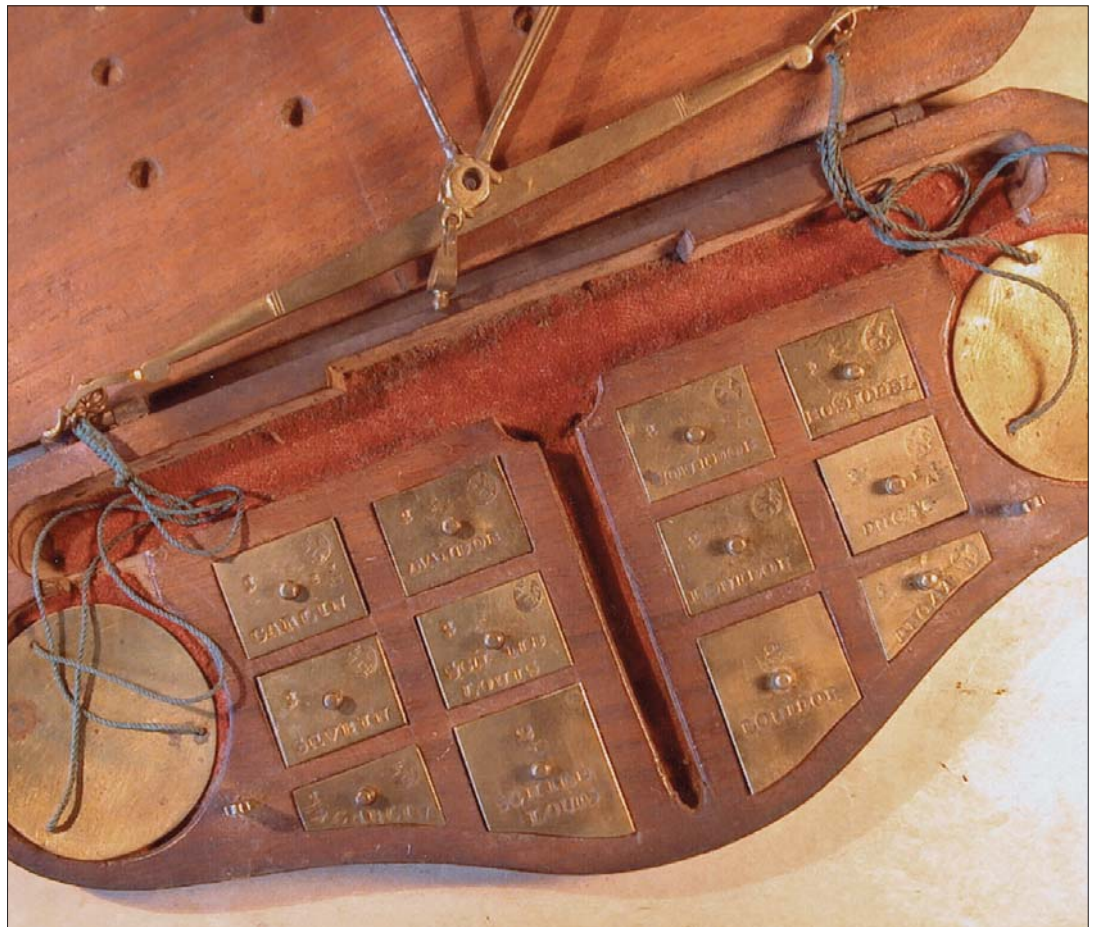
Abb. 1: Münzwaage im aufgeklappten Zustand

M ünzwaagen von Kaufmann wurden ausführlich schon in einem früheren Artikel beschrieben. Die heute vorgestellte Münzwaage von Kaufmann (Abb. 1) ist ein weiteres m. E. bisher unbekanntes Exemplar aus der Produktion von Kaufmann. Typisch sind die Steckgewichte, Lochgewichte und die z.T. geschwungen ausgebildeten Gewichte. Einige haben nur einen kleinen Griffstab. Die Vielfalt der Formen der Münzgewichte von Kaufmann ist also sehr groß (Abb. 2). Alle Gewichte (bis auf das 2-Schildlouisd'or- und das 2-Louisd'or-Gewicht) sind mit dem nach links blickenden geschweiften Löwen von Kaufmann gepunzt (Abb. 3). Beeindruckend schön ist auch die Messingwaage mit den 2 runden Messingschalen an grünen Schnüren. Besonders hervorstechend sind die „barocken“ Enden, die als typisch sächsisch bezeichnet werden dürfen (Abb. 4 und 5). Abgerundet wird das museale Exemplar mit dem Kasten (240 x 102 x 21 mm), der ebenfalls elegant geschwungen ist und oben 2 Messingschließen besitzt (Abb. 6).