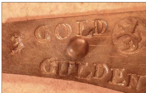
Abb. 3: 1 GOLDGULDEN mit Griffstab und dem nach links blickenden Löwen