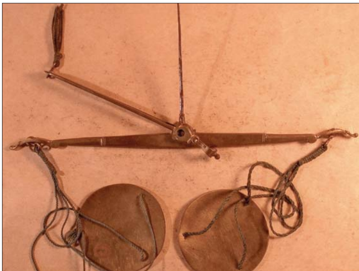
Abb. 4: Die Messingwaage