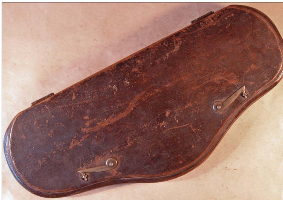
Abb. 6: Der Münzwaagenkasten

Die Gewichte weisen eine hohe Präzision auf und das Ist-Gewicht entspricht allgemein dem Soll-Gewicht. Hier die Maße der Gewichte im einzelnen: