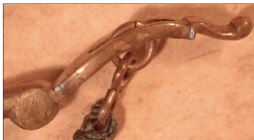
Abb. 5: Ein Ende der Messingwaage